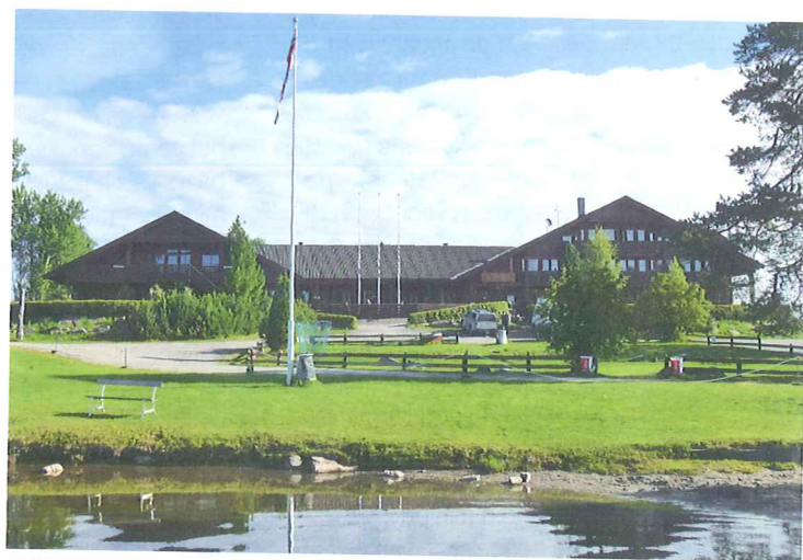
Het Toten Hotel Sillongen is ideaal voor sportvissers, centraal gelegen en met een visrijk meer voor de deur, waar baars en forel rondzwemmen.